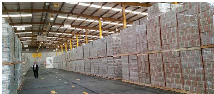
El catálogo de libros y materiales que distribuirá la SEP durante el ciclo escolar 2018-2019 constará de un acervo de 1 492 títulos.