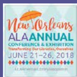
ALA (Nueva Orleans, EU) del 21 al 26 de junio