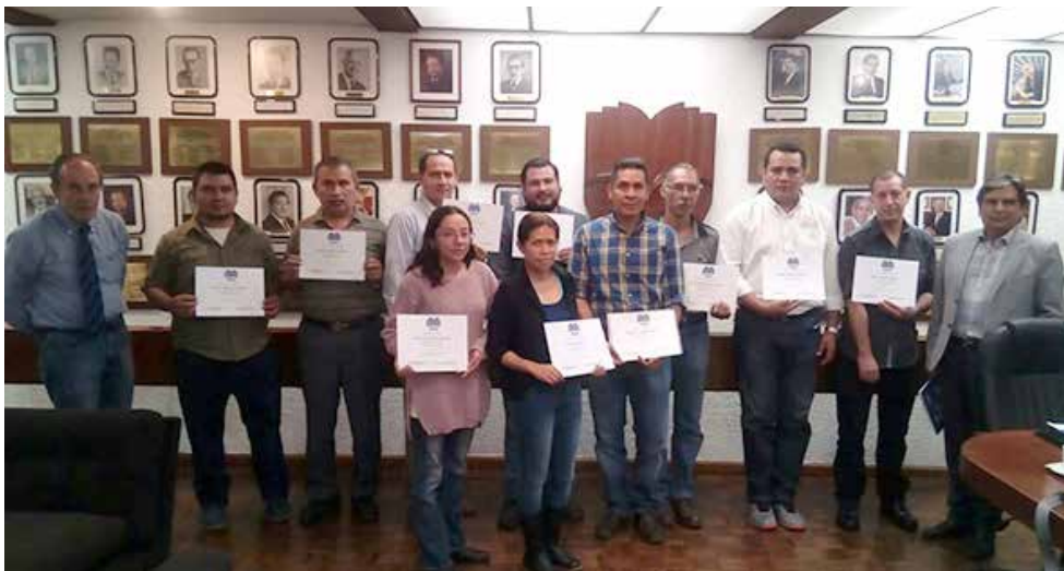
Participantes del curso.

Durante 15 horas los participantes, provenientes de empresas como: Dijuris, Instituto Mora, Lúdica Editorial, Alfaomega, El Colegio de México, Oxford University Press, CIDE, MC-Editores, Tiram le Blanc, INSP y Buro Buro, aprendieron los temas referentes a: plan de trabajo para la planeación y la organización de los almacenes; servicio al cliente en la logística; estrategia del transporte; estrategia de inventario; decisiones sobre almacenamiento y manejo de producto; organización