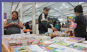
Feria Nacional del Libro Zacatecas del 25 de mayo al 3 de junio