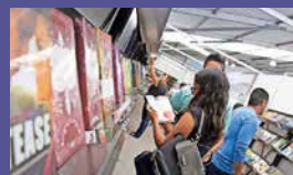
Feria del Libro de Ciudad Juárez del 26 de mayo al 3 de junio