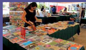
FIL Artega, Coahuila del 8 al 17 de septiembre