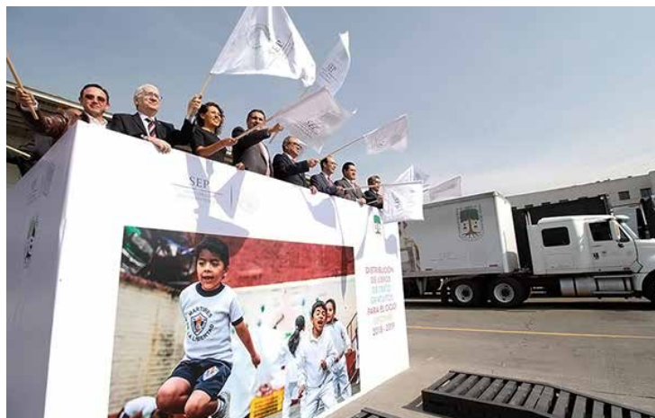
La SEP asume el compromiso de entregar todos los libros en los 595 almacenes y centros de acopio de los estados y la Ciudad de México, a más tardar el 20 de julio.